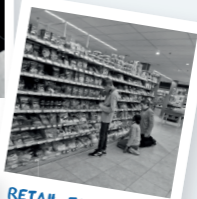
RETAIL, TRANSPORT EN LOGISTIEK