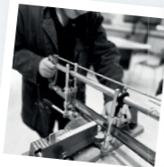
CONSTRUCTIE EN INSTALLATIETECHNIEK