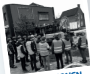
BOUW, WONEN EN ONDERHOUD

Leerlingen in het praktijkonderwijs volgen een samengesteld pakket aan theorie- en praktijkvakken. Welke vakken een leerling precies volgt, hangt af van het gekozen beroepsprofiel. Onze leerlingen leren vooral door doen en zijn sterk en talentvol in de praktische vakken.