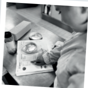
HORECA EN VOEDING